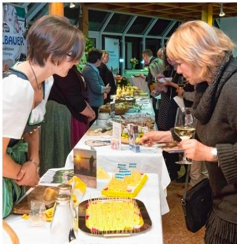
Vier Direktvermarkter stellten ihre Produkte vor und sorgten für die Verköstigung am Abend.