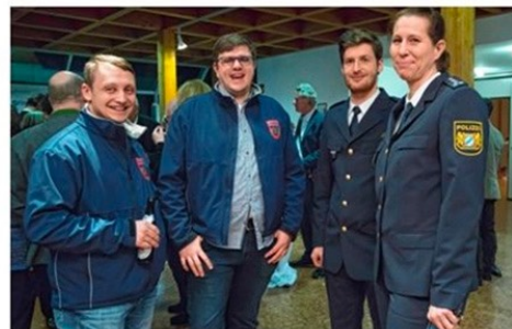
Vertreter von Vereinen und Institutionen nutzen den Empfang ebenfalls zum Austausch.