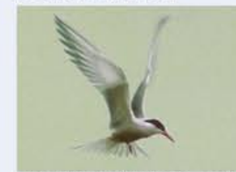
Fluss-Seeschwalbe ( Sterna hirundo , engl. Common Tern), sehr selten geworden Brutvogel, April bis September