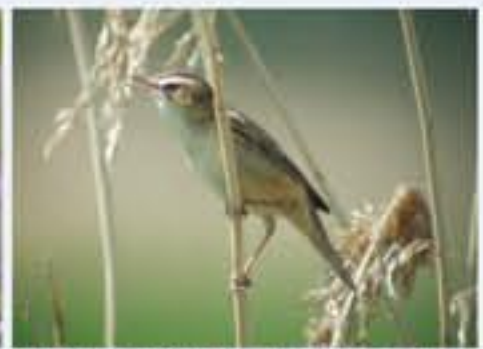
Schilfrohrsänger ( Acrocephalus schoenobaenus , engl. Sedge Warbler), Brutvogel, April bis Oktober