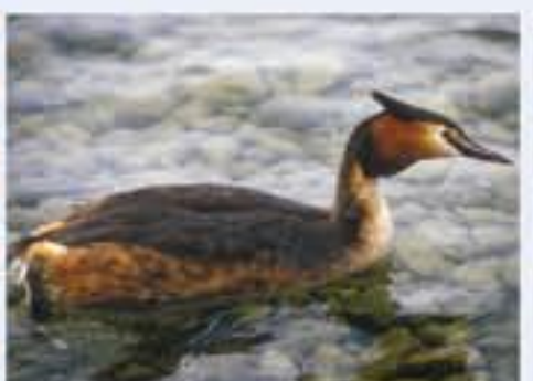
Häubentaucher ( Oriolus oriolus , engl. Great Crested Grebe), Brutvogel, ganzjährig