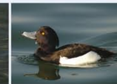
Rehente ( Aythya fuligula , engl. Tufted Duck), Brutvogel, ganzjährig, im Winter sehr häufig