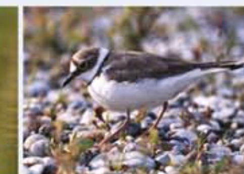
Flussregenpfeifer ( Charadrius dubius , engl. Little Ringed Plover), Brutvogel, März bis Oktober