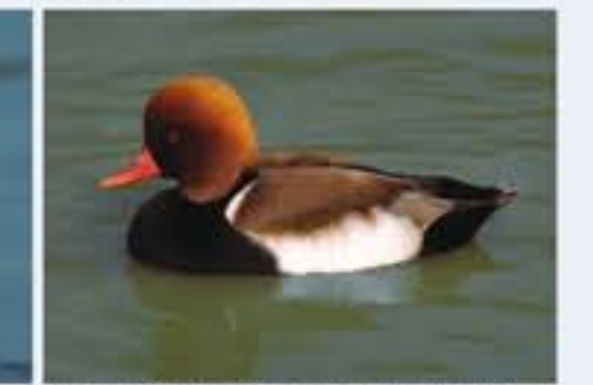
Kolbenente ( Netta rufina , engl. Red-crested Pochard), Brutvogel, ganzjährig