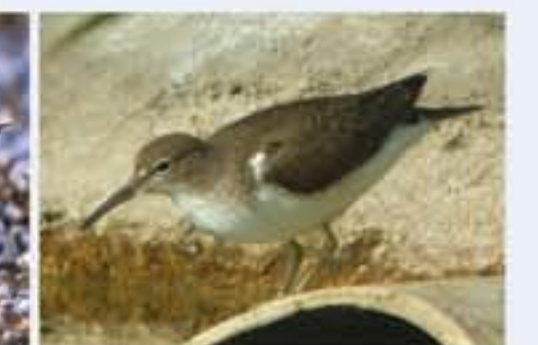
Flussuferläufer ( Actitis hypoleucos , engl. Common Sandpiper), Durchzügler, April bis Oktober, sehr seltener Brutvogel