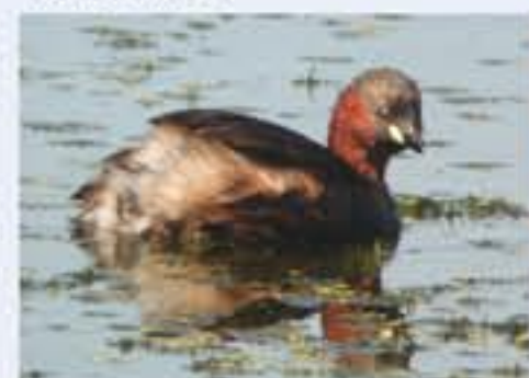
Zwergtaucher ( Tachybaptus ruficollis , engl. Little Grebe), Brutvogel, ganzjährig