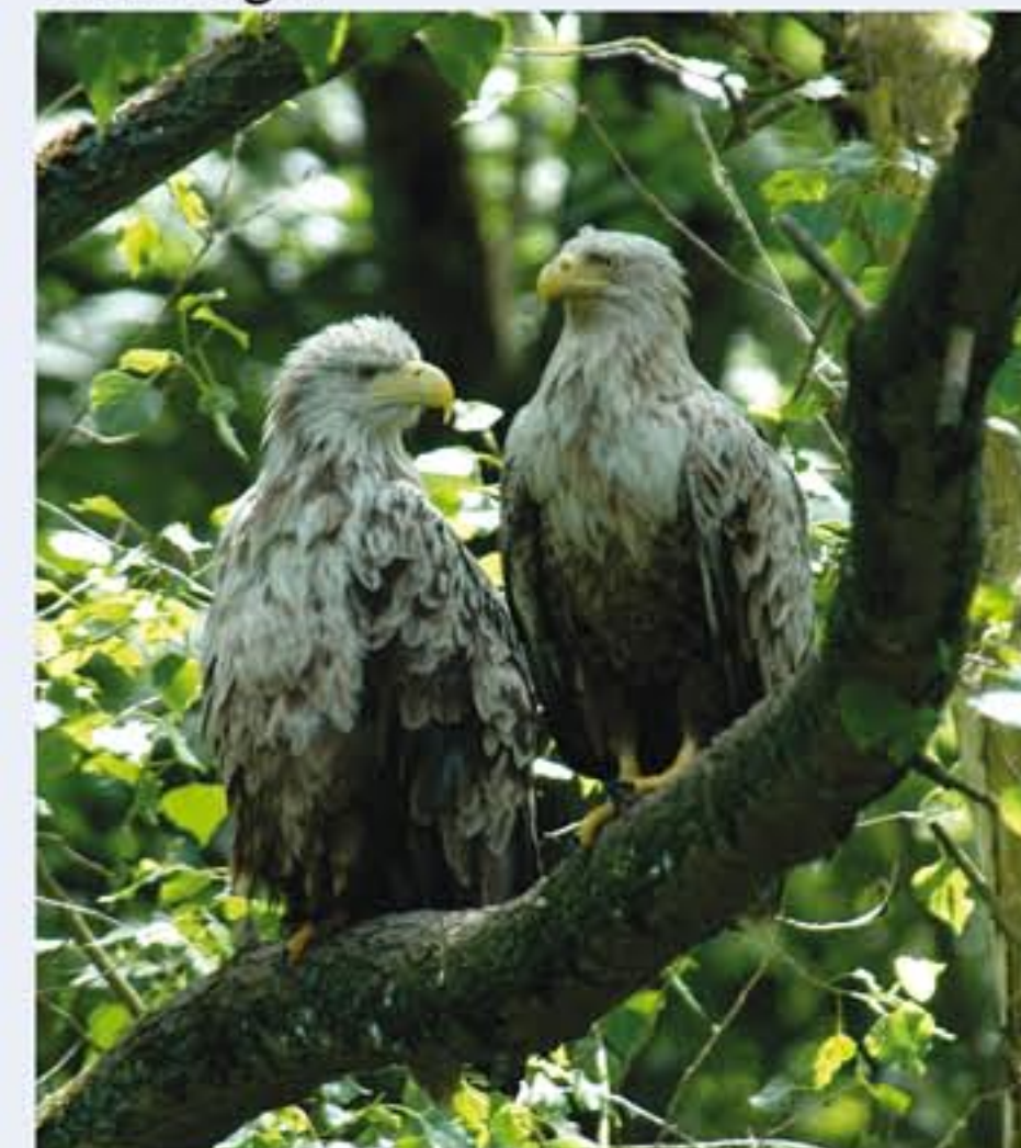
Seeadler ( Haliaeetus albicilla , engl. White-tailed Eagle), Wintergast, Oktober bis März