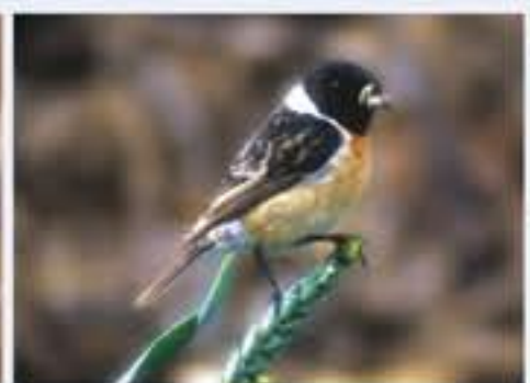
Schwarzkehlchen ( Saxicola torquata , engl. Common Stonechat), Brutvogel erst seit 1985, März bis Oktober