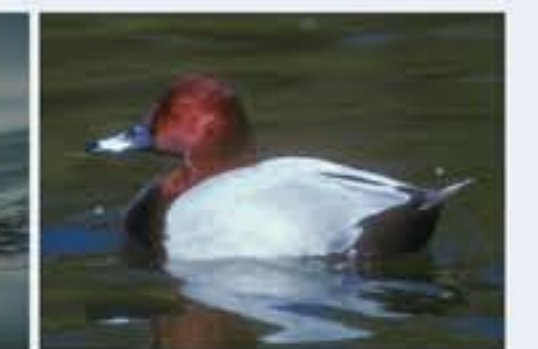
Tafelente ( Aythya ferina , engl. Common Pochard), ganzjährig, häufig nur im Winter