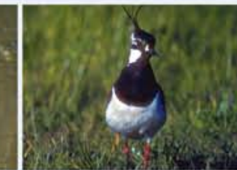
Kiebitz ( Vanellus vanellus , engl. Lapwing), Brutvogel, ganzjährig, im Winter selten