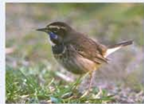
Blaukehlchen ( Luscinia svecica , engl. Bluethroat), Brutvogel, März bis Oktober