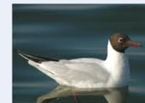
Lachmöwe ( Larus ridibundus , engl. Black-headed Gull), Brutvogel, ganzjährig