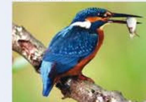
Eisvogel ( Alcedo atthis , engl. River Kingfisher), Brutvogel, ganzjährig