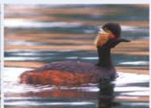
Schwarzhalbtaucher ( Podiceps nigricollis , engl. Black-necked Grebe), Brutvogel, im Winter selten