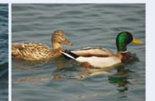
Stockente ( Anas platyrhynchos , engl. Mallard), Brutvogel, ganzjährig