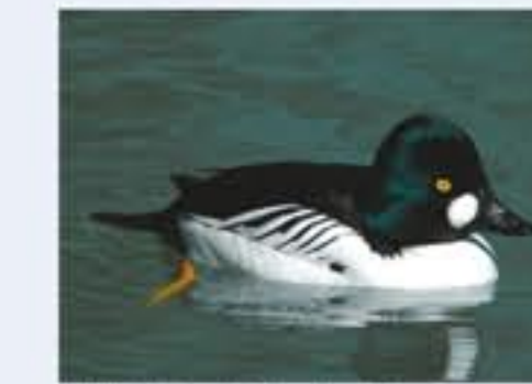
Schellente ( Bucephala clangula , engl. Common Goldeneye), Brutvogel, ganzjährig