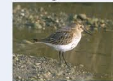
Bruchwasserläufer ( Tringa glareola , engl. Wood Sandpiper), Durchzügler, Juli bis September