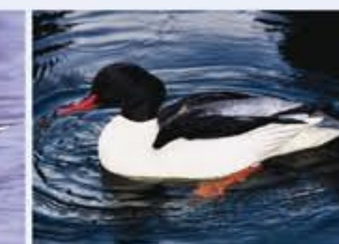
Gänseräger ( Mergus mergamus , engl. Goosander), seltener Brutvogel, ganzjährig