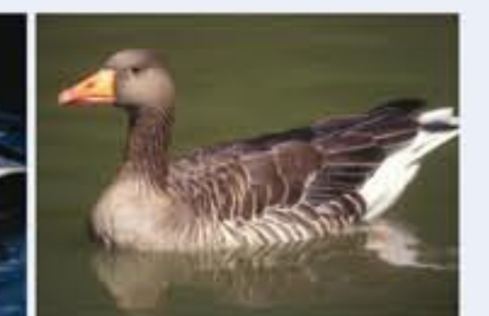
Graugans ( Anser anser , engl. Greylag Goose), Brutvogel, ganzjährig