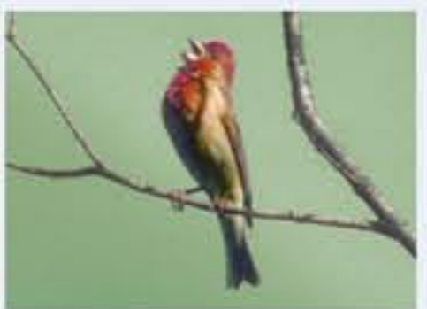
Kornringel ( Carpodacus erythrinus , engl. Common Rosefinch), Brutvogel erst seit 1983, Mai bis August