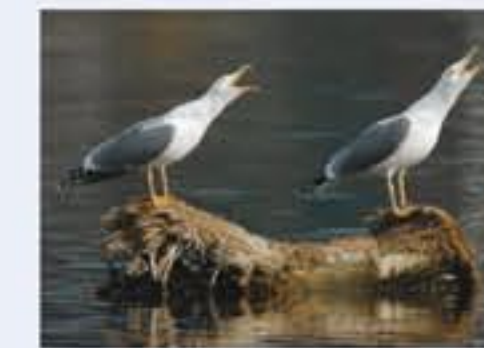
Mittelmeermöwe ( Larus michahellis , engl. Yellow-legged Gull), Brutvogel, ganzjährig