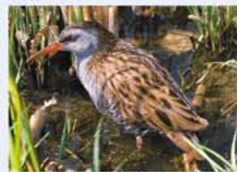
Wasserralle ( Rallus aquaticus , engl. Water Rail), Brutvogel, ganzjährig, im Winter selten