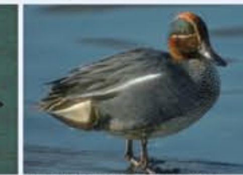
Krickente ( Anas crecca , engl. Green-winged Teal), Brutvogel, ganzjährig