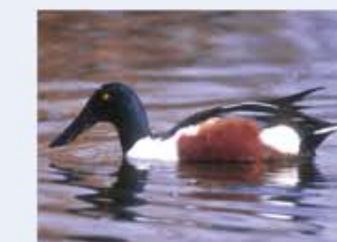
Löffelente ( Anas clypeata , engl. Northern Shoveler), Brutvogel, ganzjährig