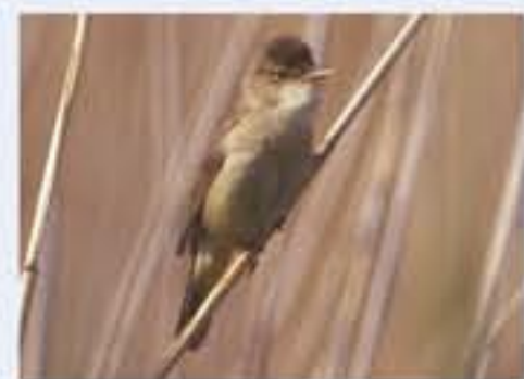
Tschuhrsänger ( Acrocephalus scirpaceus , engl. Reed Warbler), Brutvogel, April bis Oktober