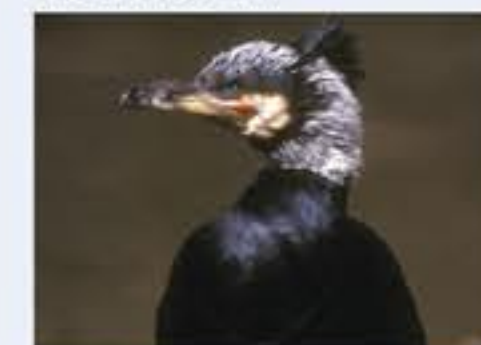
Kormoran ( Phalacrocorax carbo , engl. Great Cormorant), Brutvogel, ganzjährig