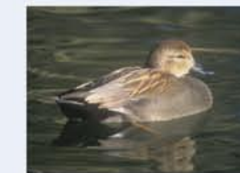
Schrotterente ( Anas strepera , engl. Gadwall), Brutvogel, ganzjährig