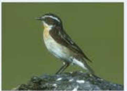
Braunkehlchen ( Saxicola rubetra , engl. Whinchat), Brutvogel, April bis Oktober