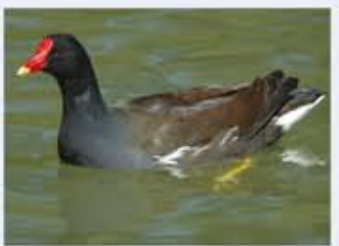
Tschuhne ( Gallinula chloropus , engl. Moorhen), Brutvogel, ganzjährig