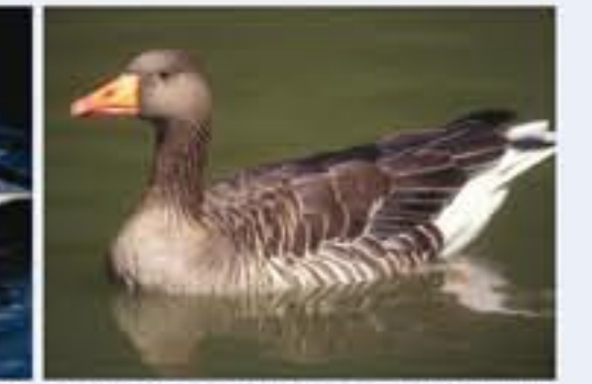
Graugans ( Amer cygnus , engl. Greyling Goose), Brutvogel, ganzjährig