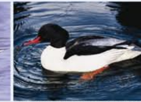
Gänssäger ( Mergus merganser , engl. Goosander), seltener Brutvogel, ganzjährig