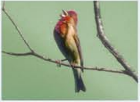
Kornelröschen ( Carpodacus erythrinus , engl. Common Rosefinch), Brutvogel, erst seit 1987, Mai bis August