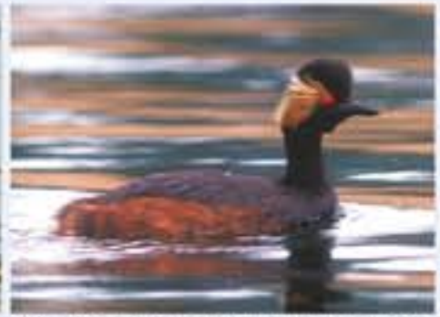
Schwarzhalbläucher ( Podiceps nigricollis , engl. Black-necked Grebe), Brutvogel, im Winter selten