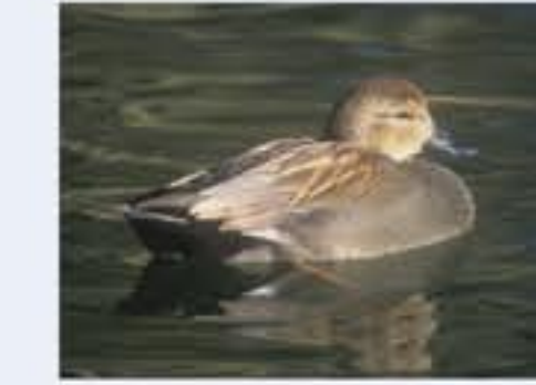
Schnatterente ( Anas strepera , engl. Gadwall), Brutvogel, ganzjährig