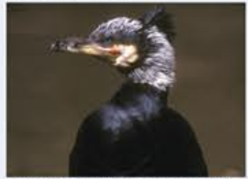
Kormoran ( Phalacrocorax carbo , engl. Great Cormorant), Brutvogel, ganzjährig