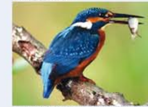
Eisvogel ( Alcedo atthis , engl. River Kingfisher), Brutvogel, ganzjährig