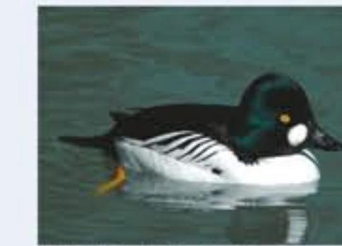
Schellente ( Bucephala clangula , engl. Common Goldeneye), Brutvogel, ganzjährig