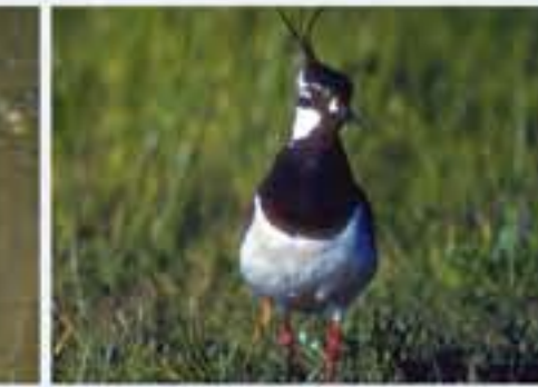
Kahrt ( Vanelus vanellus , engl. Lapwing), Brutvogel, ganzjährig, im Winter selten