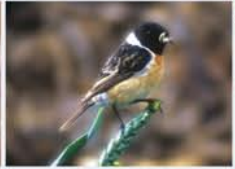
Schwarzkehlchen ( Saxicola torquata , engl. Common Stonechat), Brutvogel, erst seit 1985, März bis Oktober