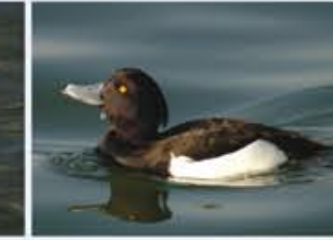
Rehente ( Aythya fuligula , engl. Tufted Duck), Brutvogel, ganzjährig, im Winter sehr häufig