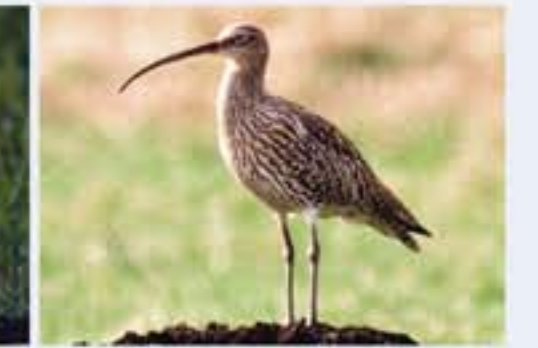
Brachvogel ( Numenius angusta , engl. Western Cullin), seltener Brutvogel und ganzjähriger Gast