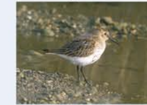
Apenninstrandläufer ( Calidris alpina , engl. Dunlin), Durchzügler, August bis November