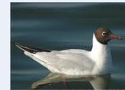
Lachmöwe ( Larus ridibundus , engl. Black-headed Gull), Brutvogel, ganzjährig