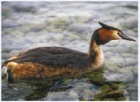
Haupttaucher ( Grus grus , engl. Great Crested Grebe), Brutvogel, ganzjährig