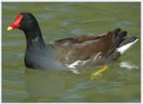
Teichhuhn ( Gallinula chloropus , engl. Moorhen), Brutvogel, ganzjährig