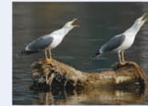
Mittelsiemensgans ( Larus michahellis , engl. Yellow-legged Gull), Brutvogel, ganzjährig