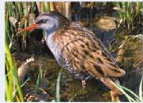
Wasserralle ( Rallus aquaticus , engl. Water Rail), Brutvogel, ganzjährig, im Winter selten