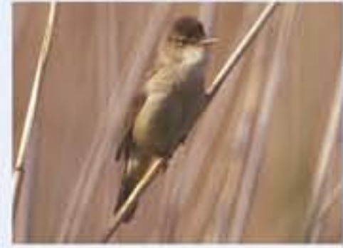
Steinbrunnen ( Acrocephalus scirpaceus , engl. Reed Warbler), Brutvogel, April bis Oktober