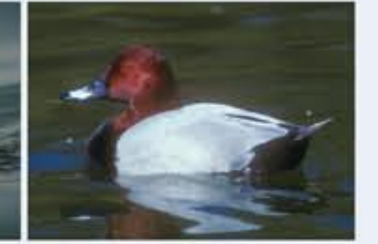
Tafelente ( Aythya ferina , engl. Common Pochard), ganzjährig, häufig nur im Winter