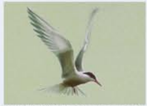
Fluss-Seeschwalbe ( Sterna hirundo , engl. Common Tern), sehr selten gewandener Brutvogel, April bis September