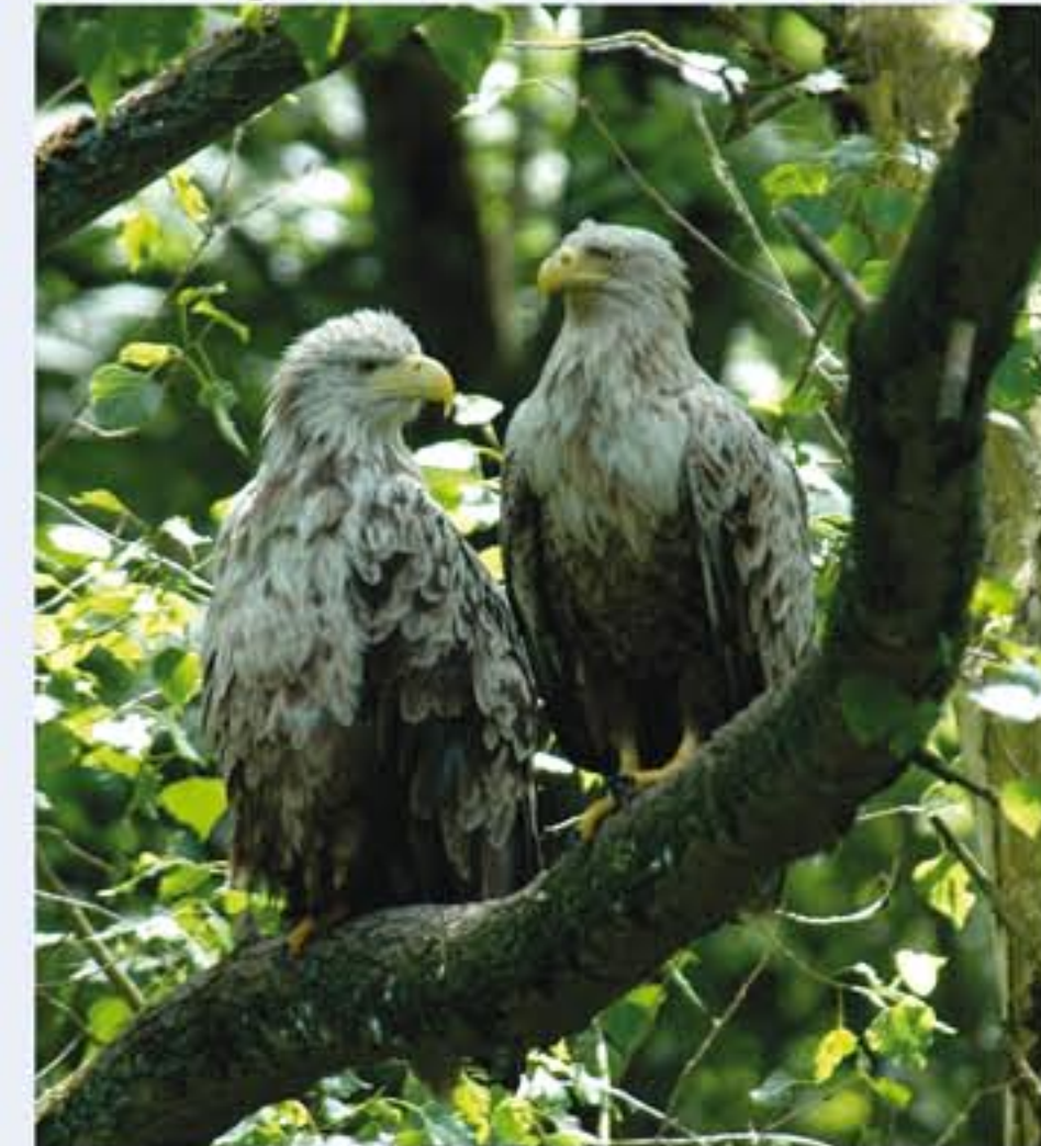
Seeadler ( Haliaeetus albicilla , engl. White-tailed Eagle), Wintergast, Oktober bis März