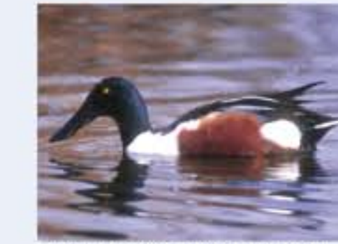
Löffelente ( Anas clypeata , engl. Northern Shoveler), Brutvogel, ganzjährig