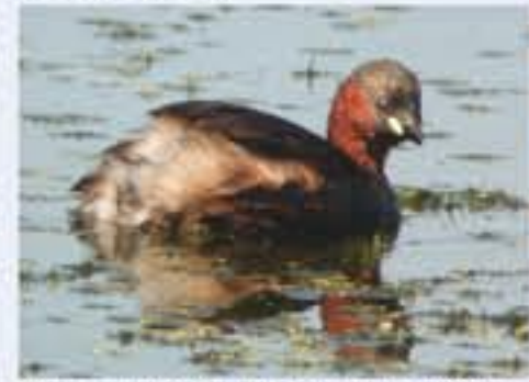
Zwergläucher ( Tachybaptus ruficollis , engl. Little Grebe), Brutvogel, ganzjährig