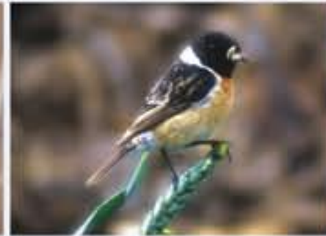
Schwarzkehlchen ( Saxicola torquata , engl. Common Stonechat), Brutvogel erst seit 1985, März bis Oktober