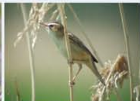
Schilfrohrsänger ( Acrocephalus schoenobaenus , engl. Sedge Warbler), Brutvogel, April bis Oktober