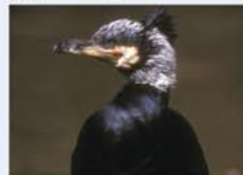
Kormoran ( Phalacrocorax carbo , engl. Great Cormorant), Brutvogel, ganzjährig