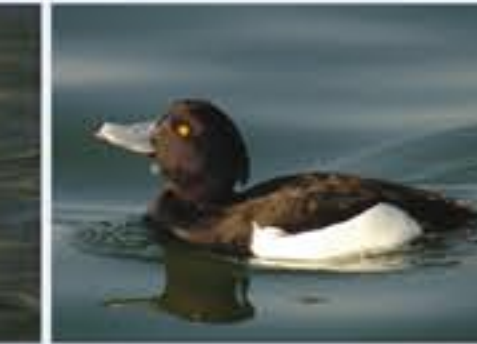
Rehente ( Aythya fuligula , engl. Tufted Duck), Brutvogel, ganzjährig, im Winter sehr häufig