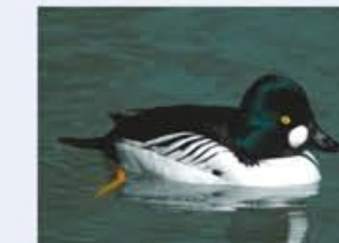
Schellente ( Bucephala clangula , engl. Common Goldeneye), Brutvogel, ganzjährig