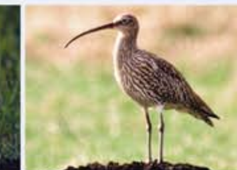
Bruchvogel ( Numenius arquata , engl. Western Curlew), seltener Brutvogel und ganzjähriger Gast