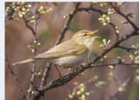
Fitis ( Phylloscopus trochilus , engl. Willow Warbler), Brutvogel, April bis September