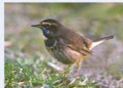
Blaukehlchen ( Luscinia svecica , engl. Bluethroat), Brutvogel, März bis Oktober

Die vielfältige Vogelwelt zählt zu den besonderen Schätzen des Chiemsees. In dem abwechslungsreichen Lebensraum mit Verlandungsflächen, Streuwiesen, Gebüsch, Wäldern und Mooren und der Wasserfläche selbst wurden seit 1950 über 300 Vogelarten, darunter etwa 125 Brutvögel, gezählt. Im Winter sind bis zu 30.000 Zugvögel aus nördlicheren Gebieten am Chiemsee versammelt.