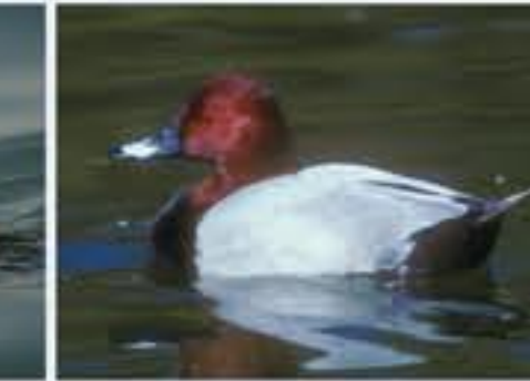
Salente ( Aythya ferina , engl. Common Pochard), ganzjährig, häufig nur im Winter