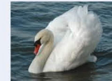
Höckerschwan ( Cygnus olor , engl. Mute Swan), Brutvogel, ganzjährig