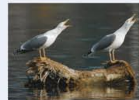
Mittelschwärmer ( Larus michahellis , engl. Yellow-legged Gull), Brutvogel, ganzjährig