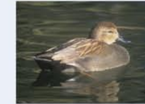
Schattente ( Anas strepera , engl. Gadwall), Brutvogel, ganzjährig