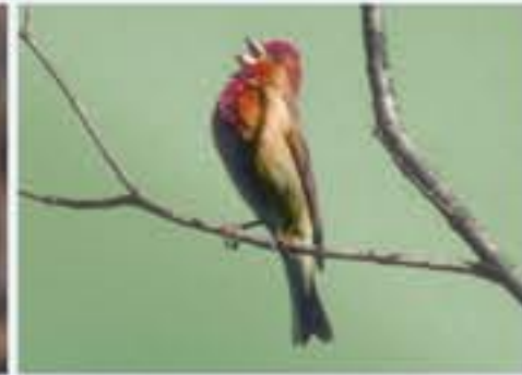
Kornispingel ( Carpodacus erythrinus , engl. Common Rosefinch), Brutvogel erst seit 1987, Mai bis August