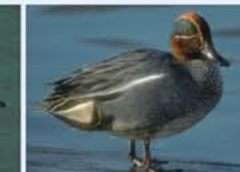
Krickente ( Anas crecca , engl. Green-winged Teal), Brutvogel, ganzjährig