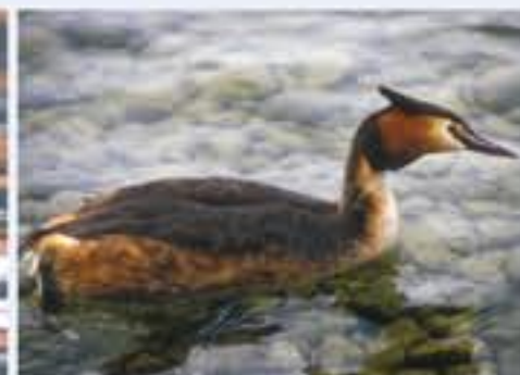
Haubentaucher ( Driolus ornatus , engl. Great Crested Grebe), Brutvogel, ganzjährig