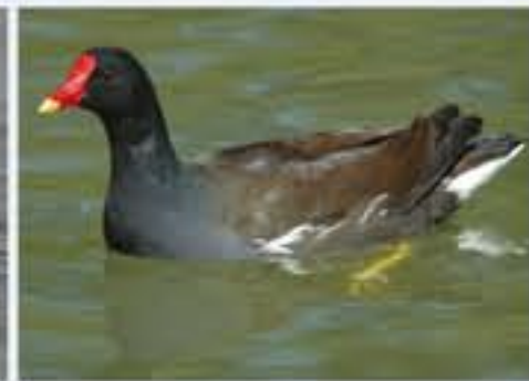
Teichhuhn ( Gallinula chloropus , engl. Moorhen), Brutvogel, ganzjährig