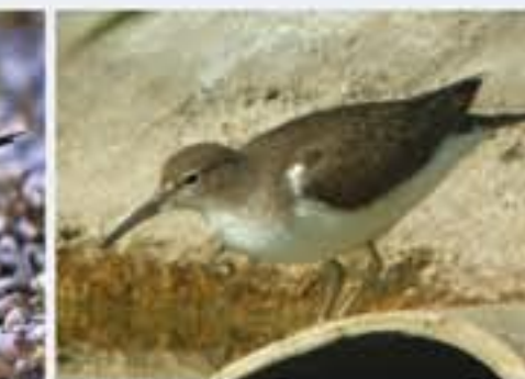
Flussuferläufer ( Actitis hypoleucos , engl. Common Sandpiper), Durchzügler, April bis Oktober, sehr seltener Brutvogel