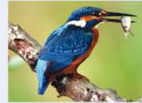
Eisvogel ( Alcedo atthis , engl. Kingfisher), Brutvogel, ganzjährig