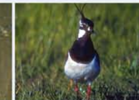
Kabitz ( Vanellus vanellus , engl. Lapwing), Brutvogel, ganzjährig, im Winter selten