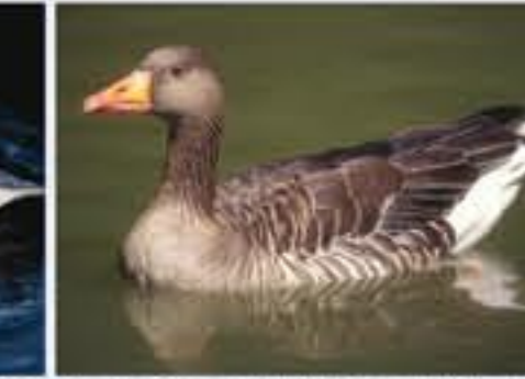
Graugans ( Anser anser , engl. Greylag Goose), Brutvogel, ganzjährig