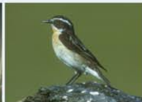
Braunkehlchen ( Saxicola rubetra , engl. Whinchat), Brutvogel, April bis Oktober