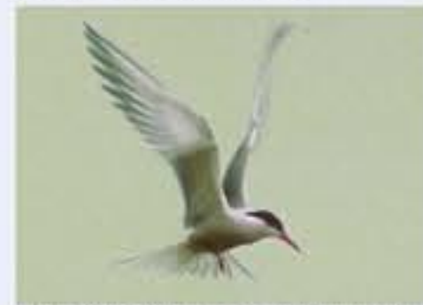
Fluss-Seeschwalbe ( Sterna hirundo , engl. Common Tern), sehr selten geworden Brutvogel, April bis September