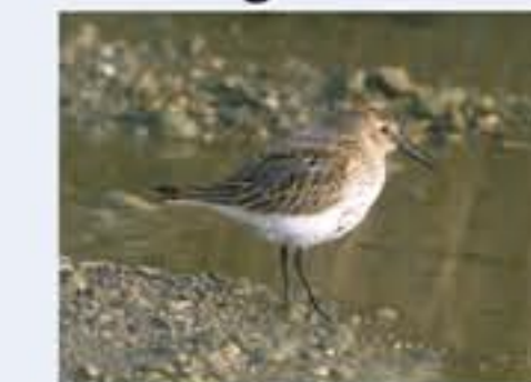
Alpenstrandläufer ( Calidris alpina , engl. Dunlin), Durchzügler, August bis November