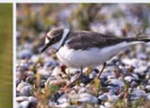
Flussregenpfeifer ( Charadrius dubus , engl. Little Ringed Plover), Brutvogel, März bis Oktober