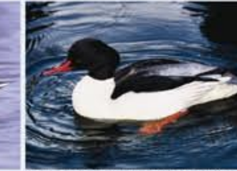
Gansvögel ( Mergus merganser , engl. Goosander), seltener Brutvogel, ganzjährig