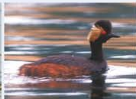
Schwarzhalbtaucher ( Podiceps nigricollis , engl. Black-necked Grebe), Brutvogel, im Winter selten