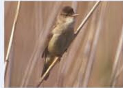
Teichrohrsänger ( Acrocephalus scirpaceus , engl. Reed Warbler), Brutvogel, April bis Oktober