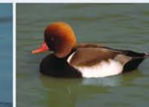
Kolbenente ( Nettion rufina , engl. Red-crested Pochard), Brutvogel, ganzjährig