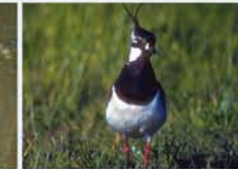
Kiebitz ( Vanellus vanellus , engl. Lapwing), Brutvogel ganzjährig, im Winter selten