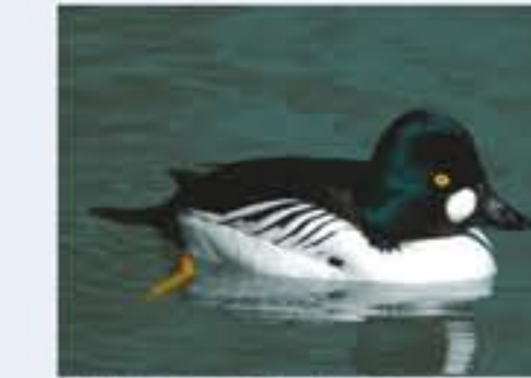
Scheitelente ( Bucephala clangula , engl. Common Goldeneye), Brutvogel, ganzjährig