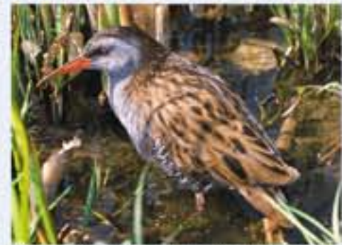
Wasserralle ( Rallus aquaticus , engl. Water Rail), Brutvogel, ganzjährig, im Winter selten