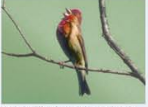
Kornelimpf ( Carduelis erythrinus , engl. Common Rosefinch), Brutvogel erst seit 1987, Mai bis August