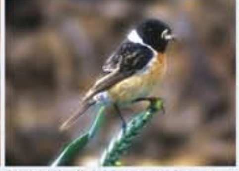
Schwarzkehlchen ( Saxicola torquata , engl. Common Stonechat), Brutvogel erst seit 1985, März bis Oktober