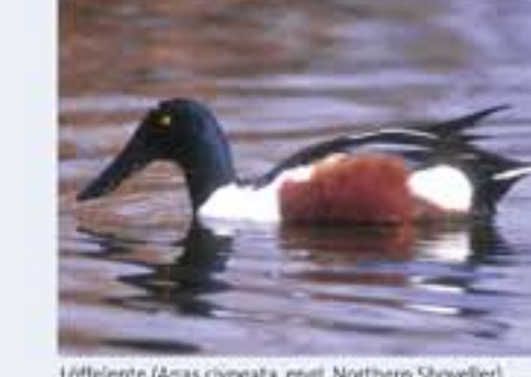
Löffelente ( Anas cyporea , engl. Northern Shoveller), Brutvogel, ganzjährig