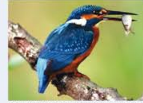
Eisvogel ( Alcedo atthis , engl. River Kingfisher), Brutvogel, ganzjährig