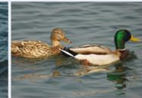
Stockente ( Anas platyrhynchos , engl. Mallard), Brutvogel, ganzjährig