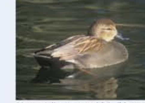
Schauenteente ( Anas strepera , engl. Cadwall), Brutvogel, ganzjährig