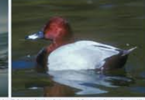
Tafelente ( Aythya ferina , engl. Common Pochard), ganzjährig, häufig nur im Winter