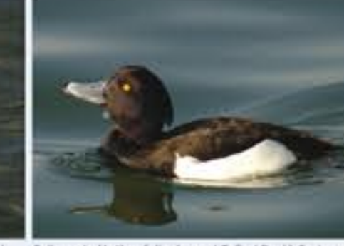
Reihenente ( Aythya fuligula , engl. Tufted Duck), Brutvogel, ganzjährig, im Winter sehr häufig