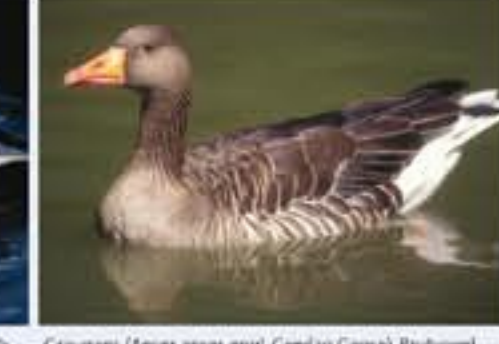
Graugans ( Anser anser , engl. Greylag Goose), Brutvogel, ganzjährig