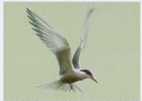
Fluss-Seeschwalbe ( Sterna hirundo , engl. Common Tern), sehr selten geworden Brutvogel, April bis September