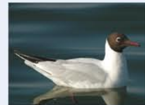
Lachmöwe ( Larus ridibundus , engl. Black-headed Gull), Brutvogel, ganzjährig