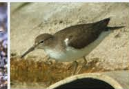
Flussuferläufer ( Actitis hypoleucos , engl. Common Sandpiper), Durchzügler, April bis Oktober, sehr seltener Brutvogel