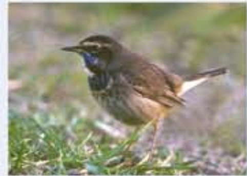
Blaukehlchen ( Luscinia svecica , engl. Bluethroat), Brutvogel, März bis Oktober

Die vielfältige Vogelwelt zählt zu den besonderen Schätzen des Chiemsees. In dem abwechslungsreichen Lebensraum mit Verlandungsflächen, Streuwiesen, Gebüsch, Wäldern und Mooren und der Wasserfläche selbst wurden seit 1950 über 300 Vogelarten, darunter etwa 125 Brutvögel, gezählt. Im Winter sind bis zu 30.000 Zugvögel aus nördlicheren Gebieten am Chiemsee versammelt.