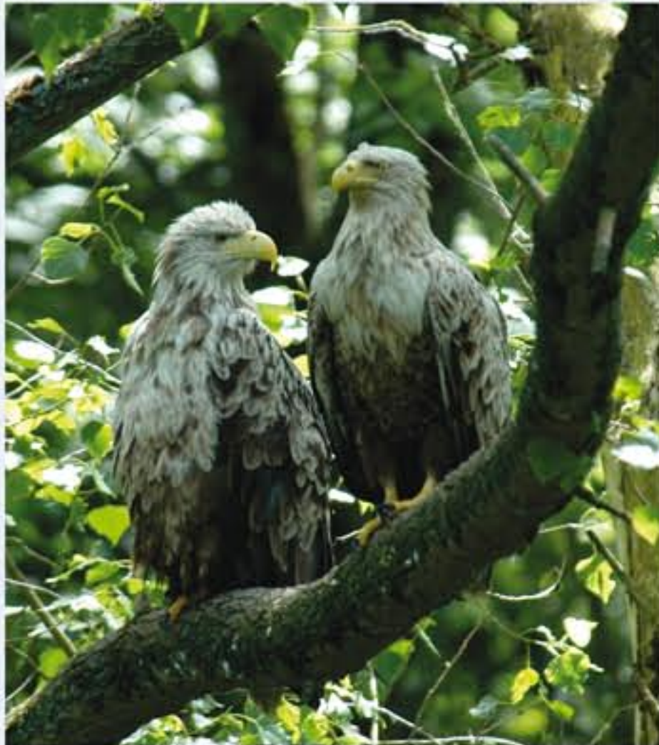
Seeadler ( Haliaeetus albicilla , engl. White-tailed Eagle), Wintergast, Oktober bis März