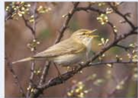
Fitis ( Phylloscopus trochilus , engl. Willow Warbler), Brutvogel, April bis September