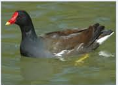
Teichhuhn ( Gallinula chloropus , engl. Moorhen), Brutvogel, ganzjährig