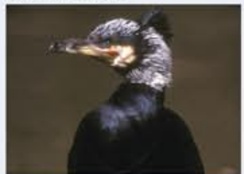
Kormoran ( Phalacrocorax carbo , engl. Great Cormorant), Brutvogel, ganzjährig