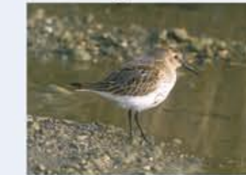
Alpenstrandläufer ( Calidris alpina , engl. Dunlin), Durchzügler, August bis November