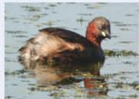
Zwergtaucher ( Tachybaptus ruficollis , engl. Little Grebe), Brutvogel, ganzjährig