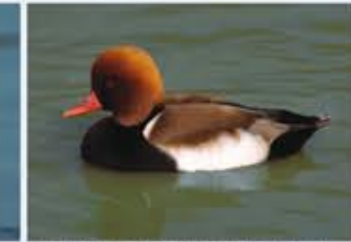
Kolbenente ( Nettion rufina , engl. Red-crested Pochard), Brutvogel, ganzjährig