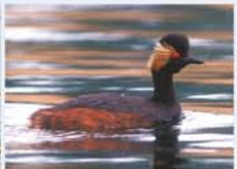
Schwarzhalbtaucher ( Podiceps nigricollis , engl. Black-necked Grebe), Brutvogel, im Winter selten