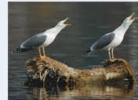
Mittelmeermöwe ( Larus michahellis , engl. Yellow-legged Gull), Brutvogel, ganzjährig