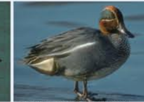
Krickente ( Anas creca , engl. Green-winged Teal), Brutvogel, ganzjährig