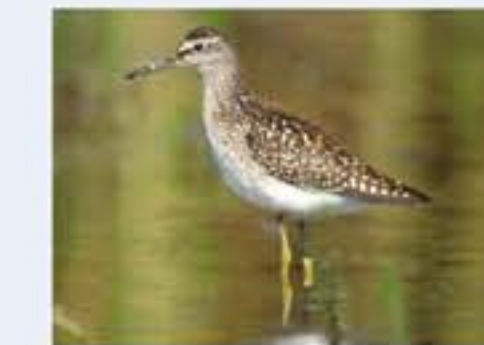
Bruchwasserläufer ( Tringa glareola , engl. Wood Sandpiper), Durchzügler, Juli bis September