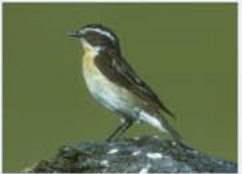
Braunkehlchen ( Saxicola rubetra , engl. Whinchief), Brutvogel, April bis Oktober