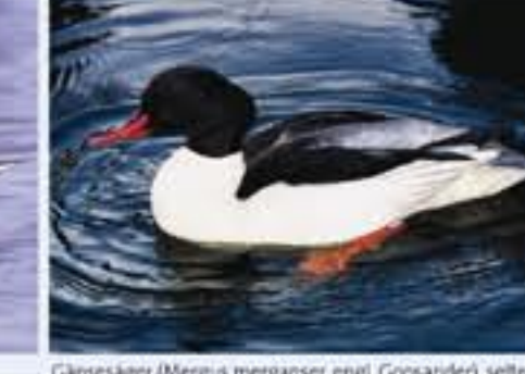
Gänseräger ( Mergus mergamus , engl. Goosander), seltener Brutvogel, ganzjährig