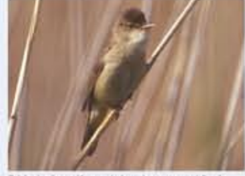
Tüpfelrohrsänger ( Acrocephalus scirpaceus , engl. Reed Warbler), Brutvogel, April bis Oktober