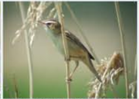
Schilfrohrsänger ( Acrocephalus schoenobaenus , engl. Sedge Warbler), Brutvogel, April bis Oktober