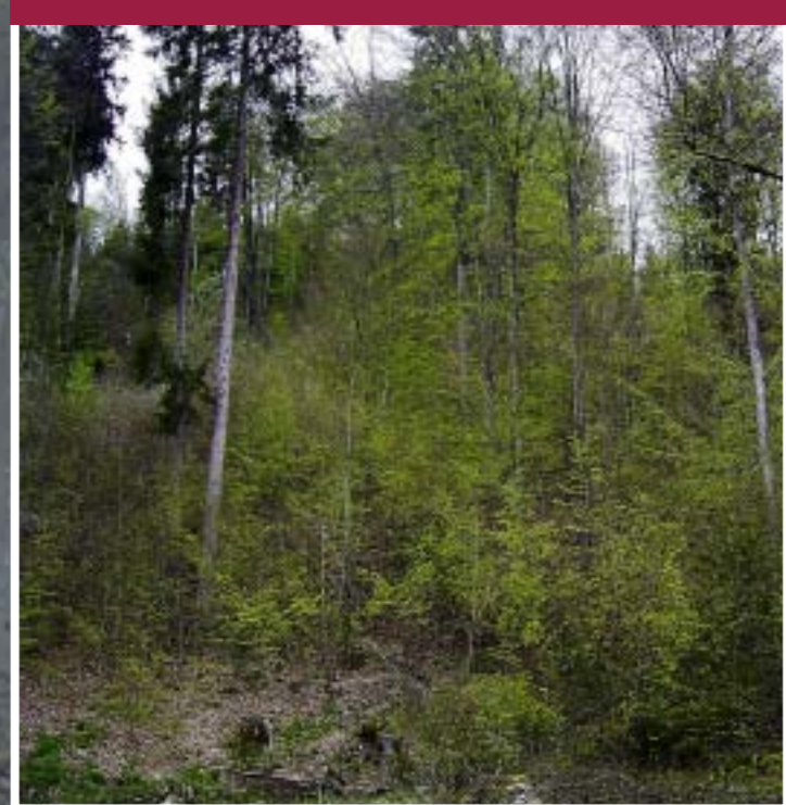
Gute Jagdlebensräume Suitable foraging habitats