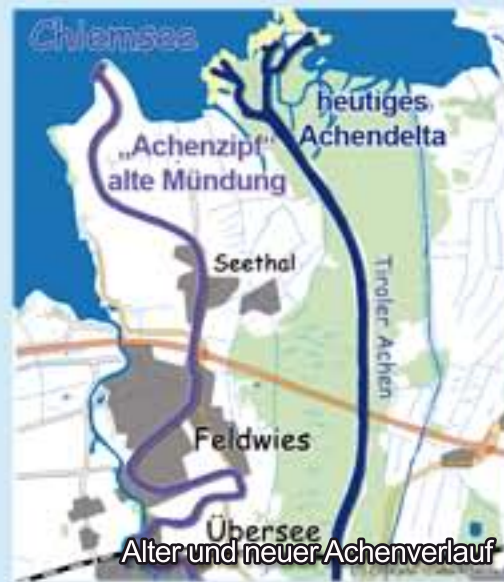
Alter und neuer Achenverlauf