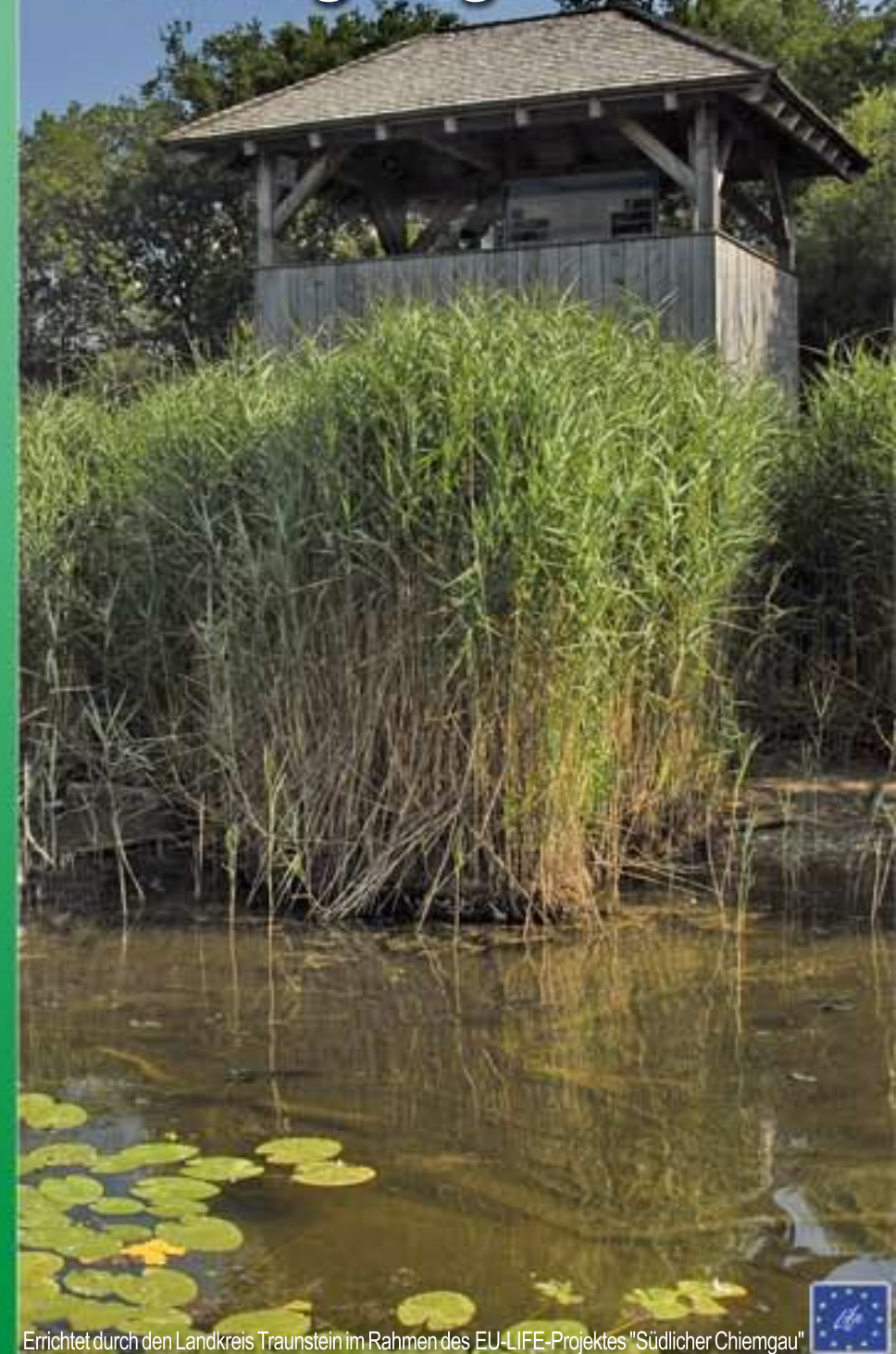
Errichtet durch den Landkreis Traunstein im Rahmen des EU-LIFE-Projektes "Südlicher Chiemgau"