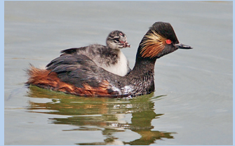
Schwarzhalstaucher mit Küken

Bei Störungen in der nahrungsarmen Winterzeit verbrauchen Wasservögel durch Flucht zusätzlich Energie und kommen schlechter durch den Winter.