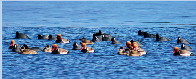
Kolbenenten und Blässhühner

Aufgrund ihres Zugverhaltens können die Vögel am Chiemsee verschiedenen Kategorien zugeordnet werden, Brutvögel, Wintergäste, Sommergäste und Durchzügler.