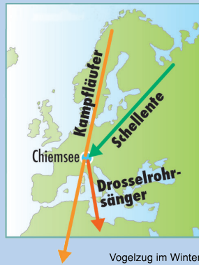
Vogelzug im Winter

Die Vogelwelt des Chiemsees bietet im Jahresverlauf ein sehr wechselvolles Bild. Während im Winter bis zu 30000 Wasservogel am See anzutreffen sind, bevölkern im Sommer nur etwa 3000 Individuen den See. Beim Vogelzug legen einige Arten sehr weite Strecken zurück, um von den Brutrevieren in das Überwinterungsgebiet zu wechseln. Wie Urlauber brauchen Zugvögel für die weite Reise ein Netz von Raststationen, an denen sie wieder „auftanken“ können. Der Chiemsee ist mit seinen 80 km 2 der größte See Bayerns und eines der wichtigsten Durchzugsgebiete nördlich der Alpen.