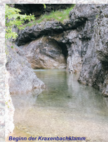
Beginn der Kraxenbachklamm

Totholz bietet Unterstände für Eidechsen und Fische und ist Lebensgrundlage für viele Insekten- und Pilzarten.