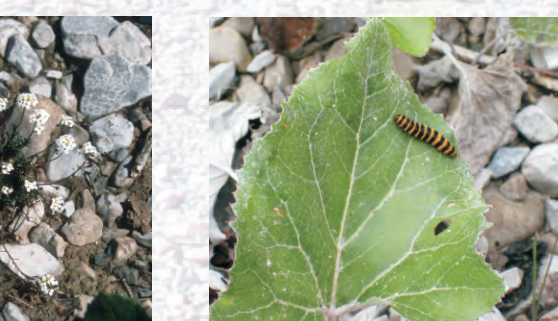
Pestwurz mit Raupe des "Blutbärs"