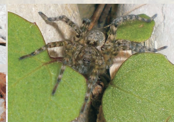
Flussschotter- Rießenwolfspinne- Arctosa cinerea

Zwischen den Steinen findet man viele Insektenarten, wie die Feldwespe, die ihr Nest an Steine heftet, Laufkäfer, Ameisen und Grashüpfer, darunter den Kiesbankgrashüpfer, eine der seltensten Heuschrecken Deutschlands. In Bayern kommt er nur auf intakten Schotterbänken der Alpenflüsse vor. Auch Spinnenarten aus den Gruppen Netz- und Laufspinnen leben im Grieß. Mit viel Glück findet man auch die seltene Flussschotter- Rießenwolfspinne (Spinne des Jahres 2007). Wolfspinnen jagen am Boden, bauen also keine Netze