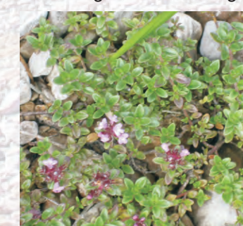
Thymian, eine Gewürzpflanze

Als Alpenschwemmlinge bezeichnet man Pflanzen, die zwischen Felsen im Gebirge wachsen und deren Samen mit dem Wasser abtransportiert werden und so auf Kiesbänken landen. Extreme Pioniereigenschaften sorgen dafür, dass sie auf nacktem Kies ohne Oberboden wachsen..