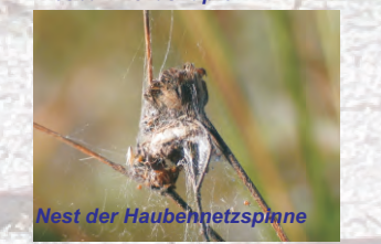
Nest der Haubennetzspinne