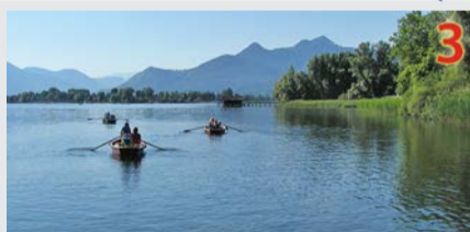
3 Mit dem Ruderboot ans Ende des Sees