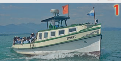
1 Erlebnisbootsfahrt an das Achen-Delta