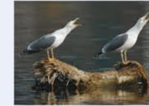
Yellow-legged Gull ( Larus michahellis , engl. Yellow-legged Gull), Brutvogel, ganzjährig