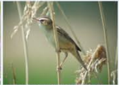
Schilfrohrsänger ( Acrocephalus schoenobaenus , engl. Sedge Warbler), Brutvogel, April bis Oktober