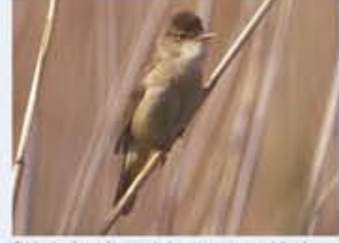
Tichrohrsänger ( Acrocephalus scirpaceus , engl. Reed Warbler), Brutvogel, April bis Oktober