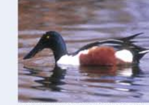
Northern Shoveller ( Anas clypeata , engl. Northern Shoveller), Brutvogel, ganzjährig