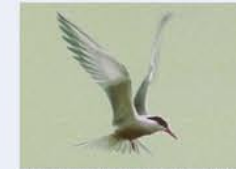
Common Tern ( Sterna hirundo , engl. Common Tern), sehr selten geworden Brutvogel, April bis September