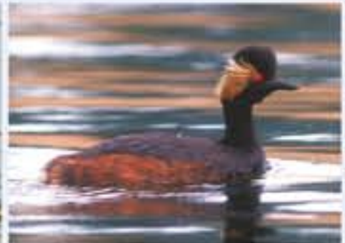
Black-necked Grebe ( Podiceps nigricollis , engl. Black-necked Grebe), Brutvogel, im Winter selten