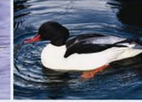
Cootenander ( Mergus mergamus , engl. Cootenander), seltener Brutvogel, ganzjährig