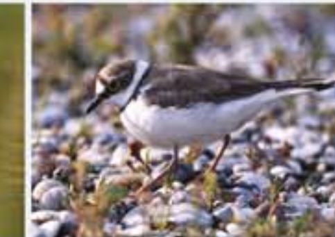
Little Ringed Plover ( Charadrius dubius , engl. Little Ringed Plover), Brutvogel, März bis Oktober