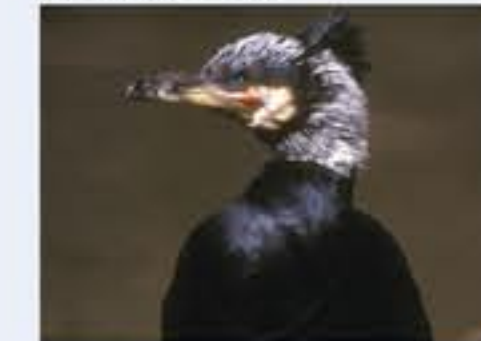
Great Cormorant ( Phalacrocorax carbo , engl. Great Cormorant), Brutvogel, ganzjährig