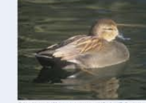
Gadwall ( Anas strepera , engl. Gadwall), Brutvogel, ganzjährig