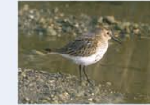
Alpenstrandläufer ( Calidris alpina , engl. Dunlin), Durchzügler, August bis November