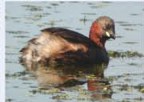
Zwergtaucher ( Tachybaptus ruficollis , engl. Little Grebe), Brutvogel, ganzjährig