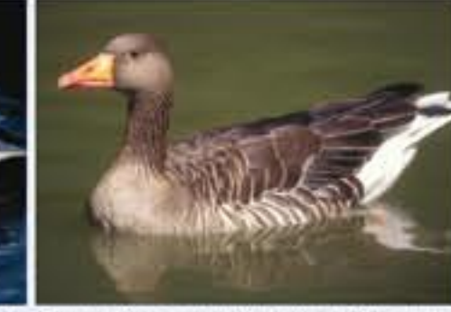
Greylag Goose ( Anser anser , engl. Greylag Goose), Brutvogel, ganzjährig