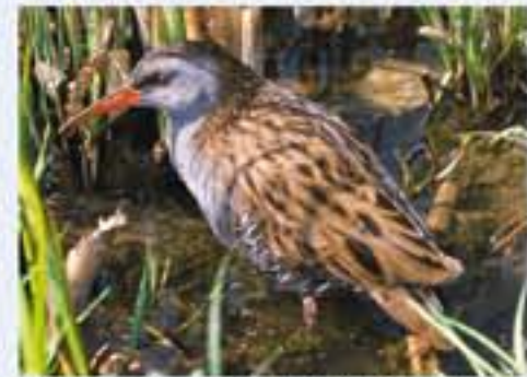
Wasserralle ( Rallus aquaticus , engl. Water Rail), Brutvogel, ganzjährig, im Winter selten