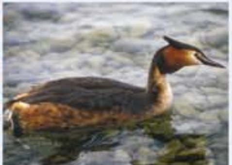
Great Crested Grebe ( Ardeotis oriolus , engl. Great Crested Grebe), Brutvogel, ganzjährig