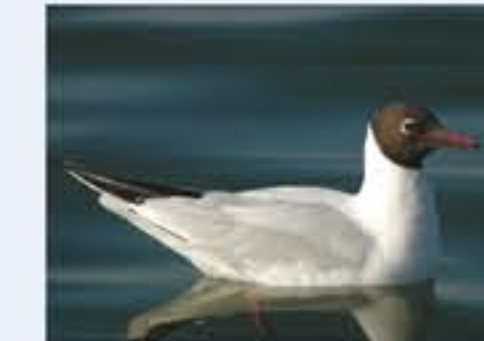
Black-headed Gull ( Larus ridibundus , engl. Black-headed Gull), Brutvogel, ganzjährig