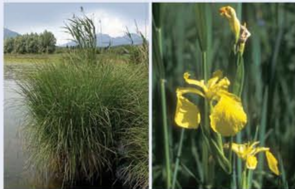
Die Steife Segge (Carex elata, engl. Tufted Sedge) bildet im tieferen Wasser mächtige Bulte.

In den flach überschwemmten, gelegentlich trockenfallenden Uferbereichen herrschen Großseggen vor. Die zunächst rasenartig wachsenden Pflanzenbestände lösen sich zum Wasser hin zunehmend auf und die Steife Segge bildet im tieferen Wasser markante Bulte. Bunt blühende und attraktive Arten, wie Gelb- und Blutweiderich und die Sumpf-Schwertilie verleihen der Zone ein reizvolles Aussehen.