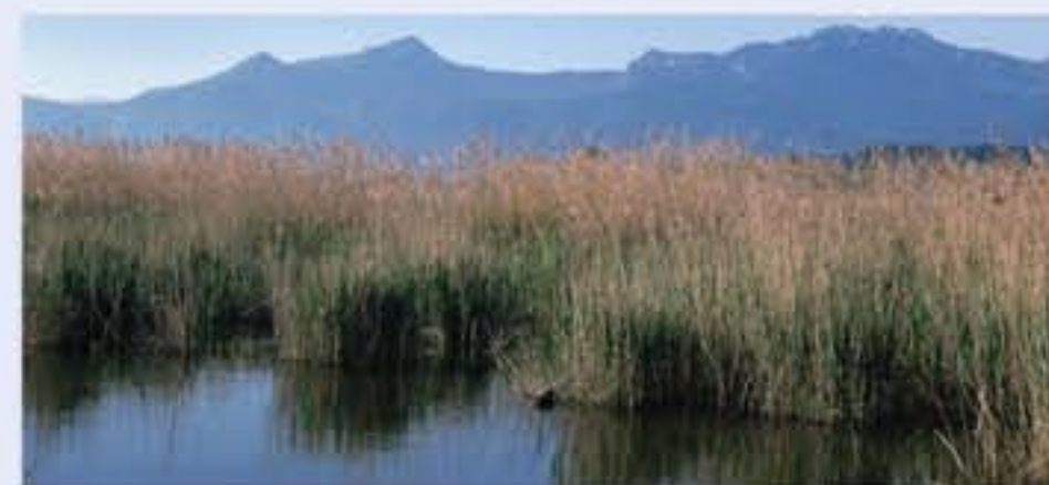
Intakte Schilfröhrichtbestände (Phragmites australis, engl. Common Reed) stellen einen wirksamen Uferschutz dar.

Im Übergang zwischen Wasser und Land bestimmen Röhrichtgürtel die Uferregion. Schilf bildet natürlicherweise ausgedehnte Reinbestände, in die einzelne Arten wie der Igelkolben, der Froschlöffel oder das Pfeilkraut eingestreut sind. Im Röhricht finden zahlreiche Vogelarten wie Zwergdommel, Rohrammer und Rohrsänger geschützte Brutplätze und sind mit ihrem Tarngefieder kaum zu entdecken. Auch Jungfische wachsen im Schutz des Röhrichts heran.