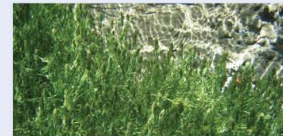
Die wiesenbildenden Armelechteralgen (Characeae) sind besonders in kalkreichen und nährstoffarmen Gewässern verbreitet.

Die urtümlichen Armelechteralgen kamen schon im Erdaltertum vor. Sie überziehen den Seeboden als moosartigen Teppich und bilden die tiefste Zone der unterseeischen Wiesen. Die mit wenig Licht auskommenden Pflanzen sind in der Regel auf sauberes Wasser angewiesen.