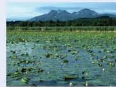
Beeindruckende Schwimmblattbestände aus weißer Seerose (Nymphaea alba, engl. White Water-lily) und gelber Teichrose (Nuphar lutea, engl. Yellow Water-lily) in der windgeschützten Bucht des Irschener Winkels.

In der windstillen Bucht des Irschener Winkels sind ausgedehnte Schwimmblattbestände mit Weißer Seerose und Gelber Teichrose zu finden. Die in ca. 1-4 m Wassertiefe wurzelnden Pflanzen schieben ihre luftgefüllten Blätter und Blüten an die Oberfläche. Auf den großen Blättern können gelegentlich umherlaufende Teichhühner auf der Suche nach Insekten beobachtet werden.