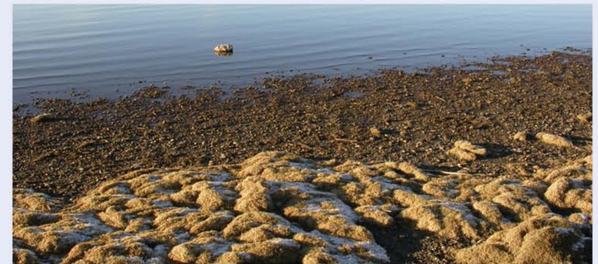
Nach Stürmen werden die moosartigen Pflanzenteile der Armelechteralgen ans Ufer gespült.