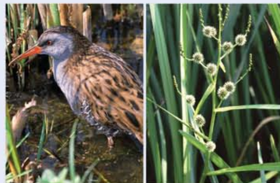
Die Wasserralle (Rallus aquaticus, engl. Water Rail) mag dichte, hohe Schilfbestände an Flüssen und Seen, in denen sie sich verstecken kann.