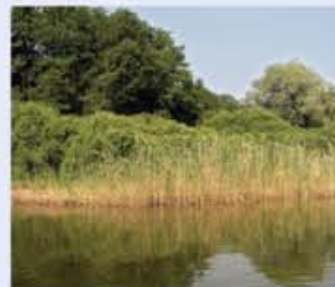
Kulissenartiges Erlen- und Weidengebüsch in der äußersten Uferzone.

Die äußerste Uferzone wird aus Feuchtwäldern und Gebüschern gebildet. In den Beständen kommen zahlreiche Strauch- und Baumarten vor, die zusammen mit der vielgestaltigen Krautschicht einen dickichtartigen, kaum zugänglichen Gehölzgürtel bilden. Reichlich vorhandenes Totholz ist von einer dichten Moosschicht überzogen. Kleintiere und Vögel nutzen die Gehölzstrukturen als Versteck und Lebensraum.